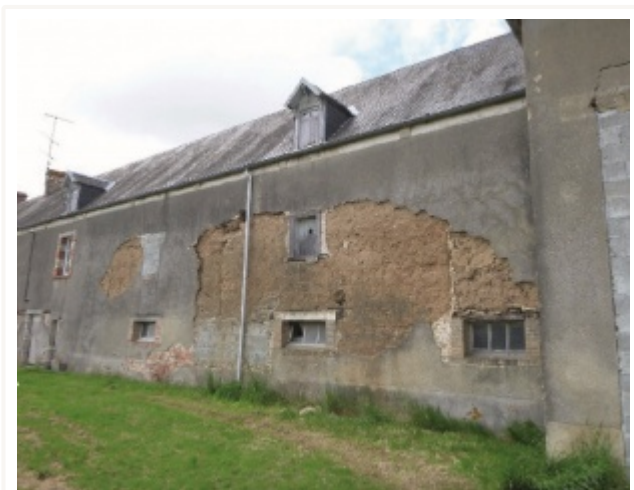
Mur en bauge recouvert d'un enduit ciment décollé