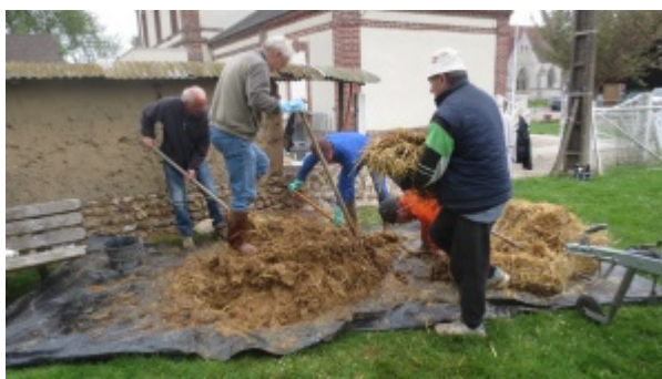
Préparation de la bauge : ajout de paille à la terre humide

Des fibres végétales sont ajoutées à la terre argileuse collante permettant une bonne tenue lors de la phase plastique ainsi qu'un séchage parfois plus rapide. Cela peut être de la paille. Il peut également y avoir des fibres animales ajoutées à la préparation.