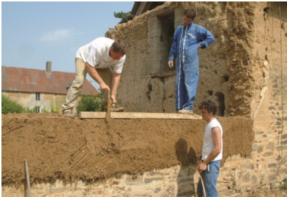
Taille au bâton d'un mur en bauge.