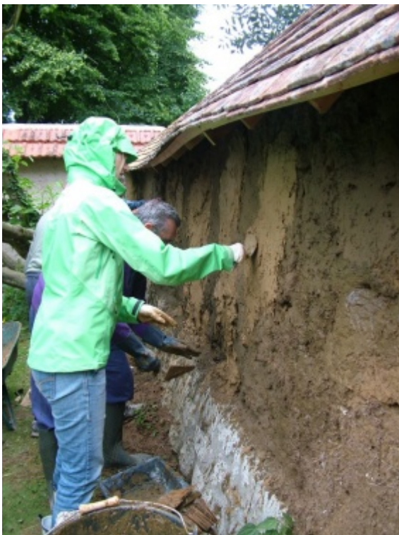
Pose d'un enduit terre sur mur en bauge.