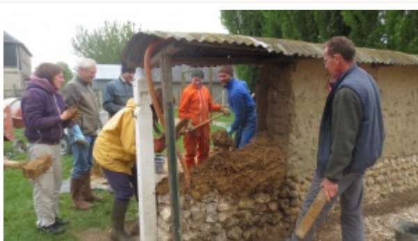
Pose de bauge avec fourche