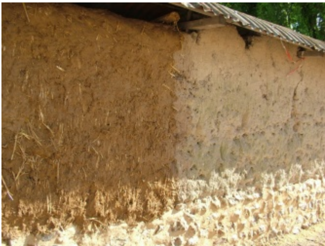
Mur en bauge restauré