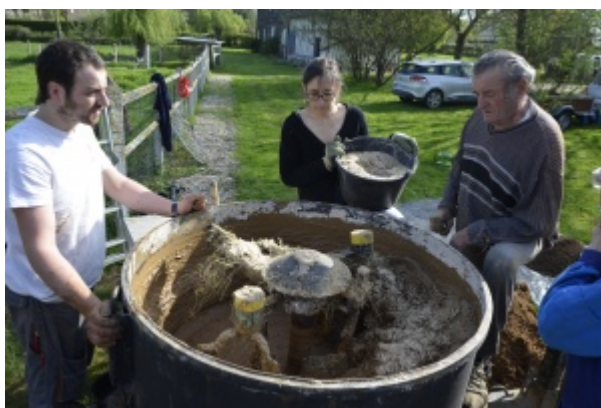
Malaxage de la terre et de la paille