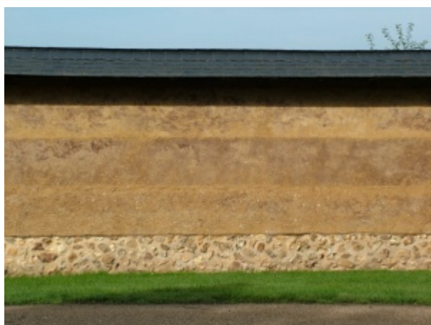
Mur en bauge monté en trois levées de 50 cm sur un soubassement de silex maçonné au mortier de chaux.