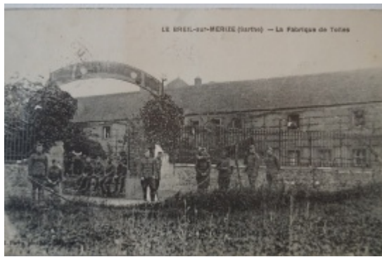
1- La fabrique de toiles.