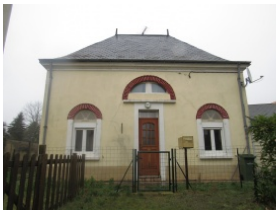
4 - Le fournil.