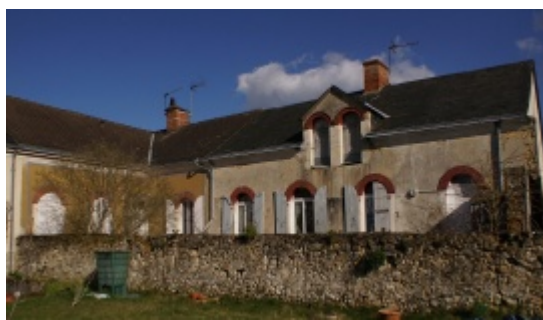
2 - Quelques logements bien conservés de la cité ouvrière.

Dans le Maine, depuis le XVII ème siècle, les activités textiles occupent des dizaines de milliers de personnes (fileuses, tisserands, maîtres fabricants et négociants...).