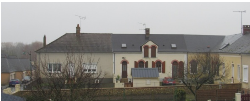
7 - Une partie de la cité ouvrière vue depuis la rue de la Fabrique.