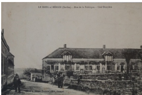
6 - Rue de la Fabrique. A gauche, la fabrique; à droite, la cité ouvrière. Carte postale, collection particulière.