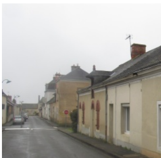
9 - Rue Coupry aujourd'hui.