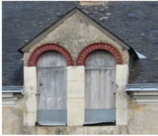
5 - Lucarne.