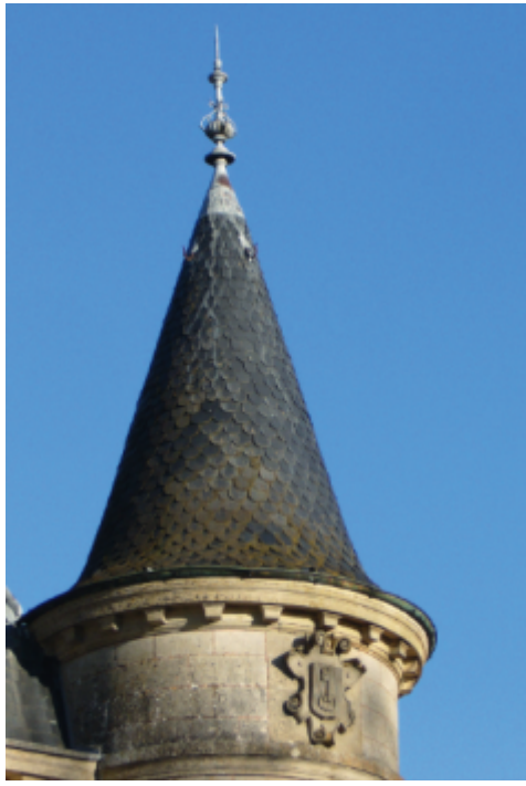
Couverture en ardoise d'un pigeonnier

Photo Maisons Paysannes de France ©, La couverture en ardoise d'une toiture en poivrière , Revue Maisons Paysannes de France, n°191, p.30