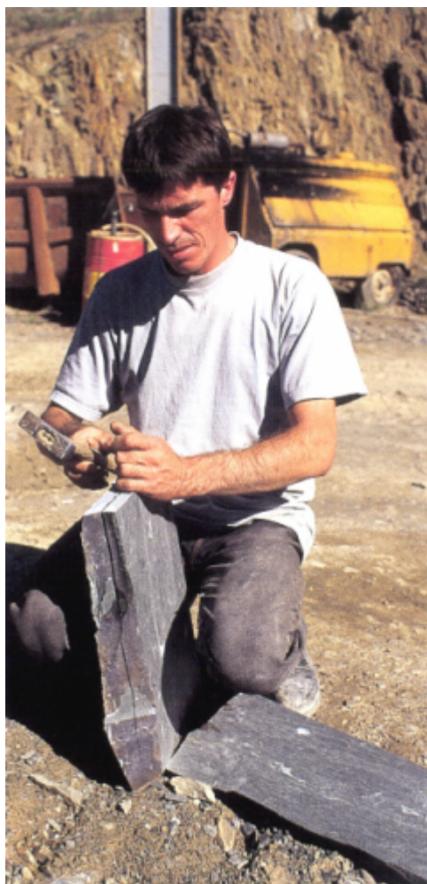
Fendage d'une ardoise