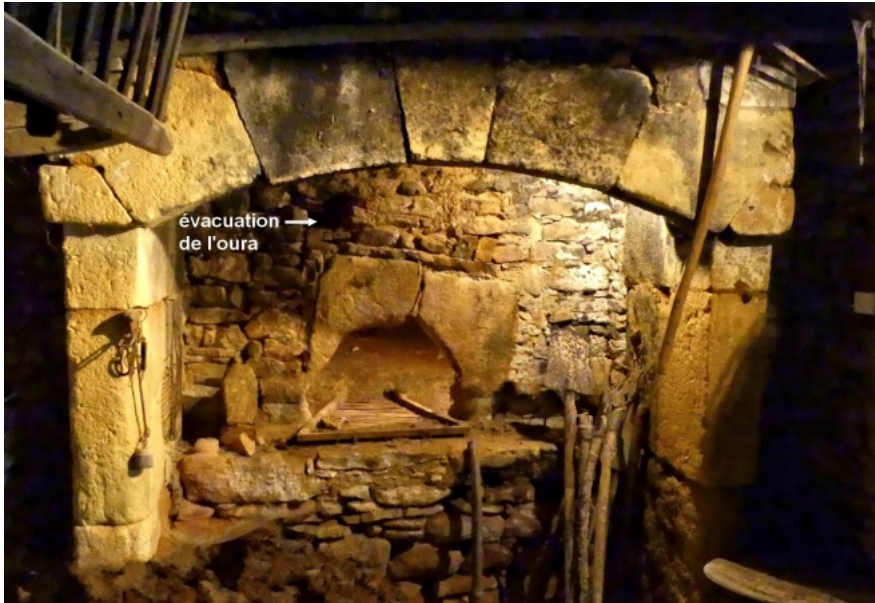
Trou d'évacuation de l'oura.