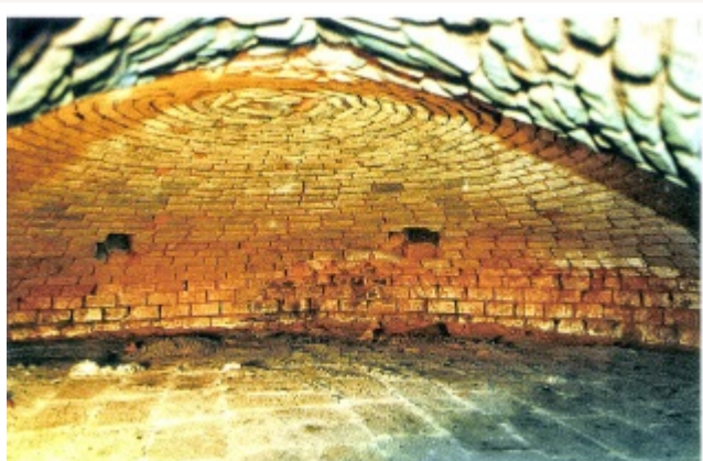
Intérieur d'un four à ouras