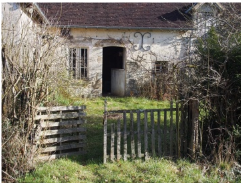
Maison à Saint-Rigomer-des- Bois, près d'Alençon: encadrements en granite, maçonnerie de pierres calcaires enduites à la chaux.