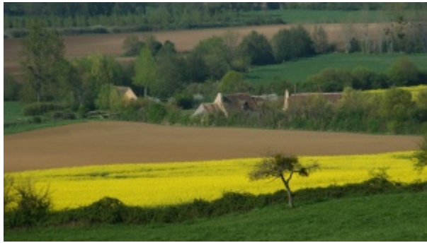
Campagne près de Ségrie.