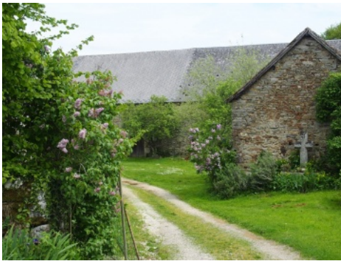
Bâtiments agricoles à Moulin-le-Carbonnel: maçonneries de grès et schiste, toitures en ardoises.