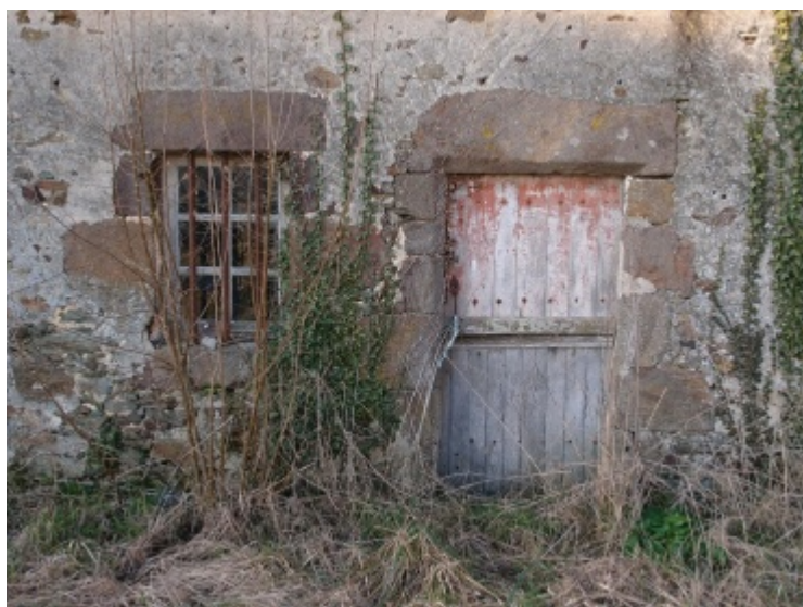
Encadrements en grès roussard à Douillet-le-Joly.

L'habitat rural sarthois est la plupart du temps dispersé au fil des exploitations. Comme souvent dans l'Ouest de la France, les maisons étaient composées d'une pièce principale (avec cheminée) ouverte vers le sud par une porte et une fenêtre, d'une pièce froide (dite chambre) avec une fenêtre et d'une étable attenante.