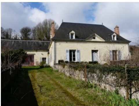
Belle maison en tuffeau à Courdemanche, dans la vallée du Loir.