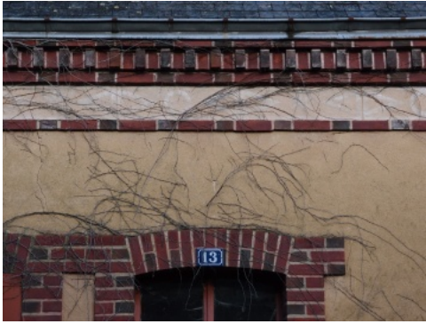
Corniche et encadrements en briques (Sud-est de la Sarthe).