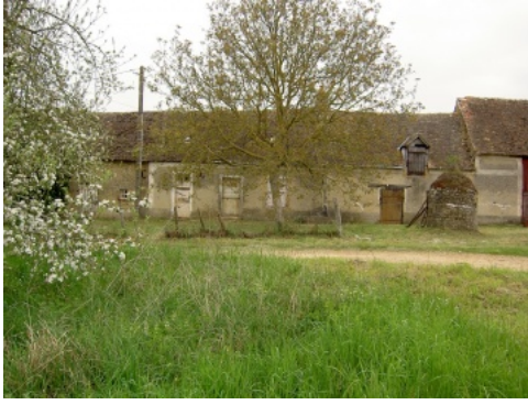
Ancienne longère typique du Nord de la Sarthe.