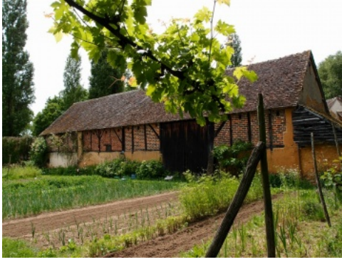
Grange à pans de bois hourdés de briques, au Nord du Mans.