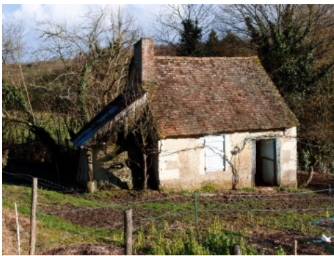
Modeste bâtisse d'une seule pièce à feu flanquée d'un four à pain dans la campagne de Courdemanche.