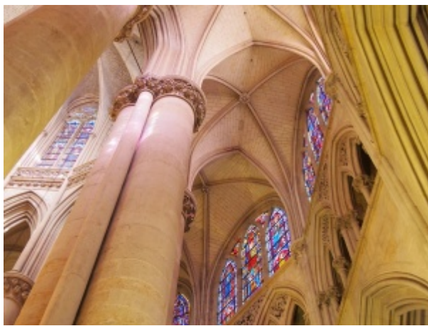
La cathédrale du Mans, aux influences angevine, normande et Ile de France.