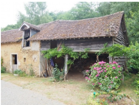
Charreterie à Beaufay, couverte d'un bardage bois et de tuiles plates.